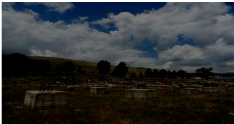
47. klasa