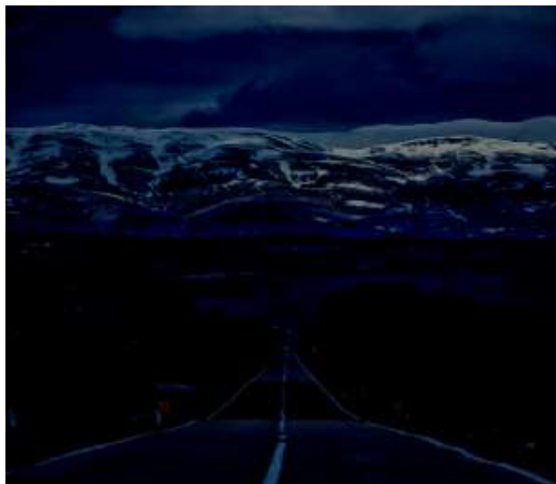
Wikipedija, dostopno 19. april 2021.