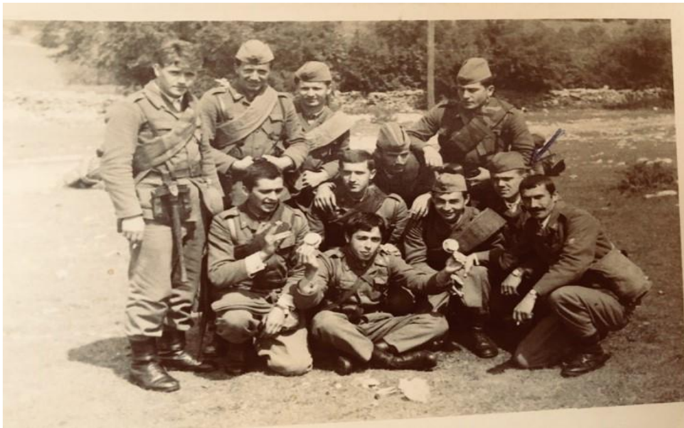
Na Bijeli Rudini – usposabljanje iz T.O. Avtor označen s puščico.