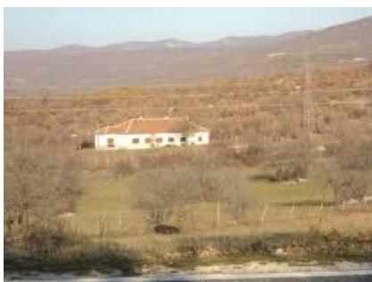
Wikipedija, dostopno dne 26.3.2020

Bijela Rudina je naselje oddaljeno od Bileće 7 km na smeri proti Gackemu. Pokrajina je rahlo valovita, kjer prevladuje hercegovski kras in porasla z nizkim grmičevjem, ki je v štiridesetih letih zelo poraslo. V tistem času se je po teh planjavah paslo veliko drobnice, ki je to grmovje objedala. Danes drobnice ni več in pokrajina se počasi zarašča. Tukaj živi 130 prebivalcev srbske narodnosti.